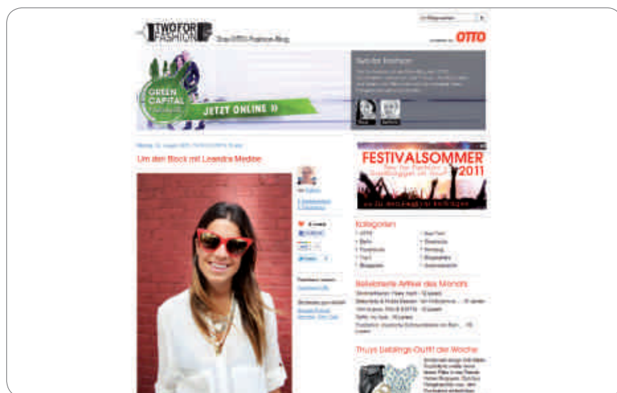
Im Corporate-Blog Two for Fashion bloggen zwei Expertinnen im Team mit Otto-Mitarbeitern über Themen rund um Mode und die Laufstege dieser Welt

len Endgeräten direkt am POS aktiv nach Empfehlungen und Informationen suchen. Untersuchungen zeigen, dass Konsumenten in der Auswahlphase dadurch – je nach Produktbereich – ein bis zwei Marken zusätzlich prüfen und in Erwägung ziehen. Insofern können Unternehmen mit sozialen und mobilen Medien neue Kontaktpunkte zur Marke etablieren und zugunsten der eigenen Marke in den Entscheidungsprozess der Kunden eingreifen. Interessant sind in dieser Hinsicht zum Beispiel die Aktivitäten des Versandhändlers Otto. Im Corporate-Blog TWO FOR FASHION bloggen zwei Expertinnen im Team mit Otto-Mitarbeitern über Themen rund um Mode und die Laufstege dieser Welt. Der Blog dient Otto als Basis für ein Social Media-Netzwerk, das auch einen eigenen Kanal auf Youtube und eine Präsenz auf Facebook umfasst. Zudem twittern die Bloggerinnen von Live-Events. Dabei wird natürlich auch immer wieder gezielt die Marke Otto ins Spiel gebracht, z.B. wenn die Bloggerinnen rechtzeitig vor Beginn des Münchner Oktoberfests davon berichten, wie sie auf einem Waldfest am Tegernsee die hauseigenen Dirndl Probe tragen. Die direkte Auslösung von Käufen steht heute für die meisten Unternehmen allerdings noch im Hintergrund. Nur 35 Prozent der Unternehmen sehen die Absatzförderung als ein Kernziel beim Einsatz digitaler Unternehmensmedien an. Hier gibt es für die Zukunft noch Potenziale, intelligente Verknüpfungen zwischen journalistischen Inhalten und Einkaufsmöglichkeiten zu schaffen.